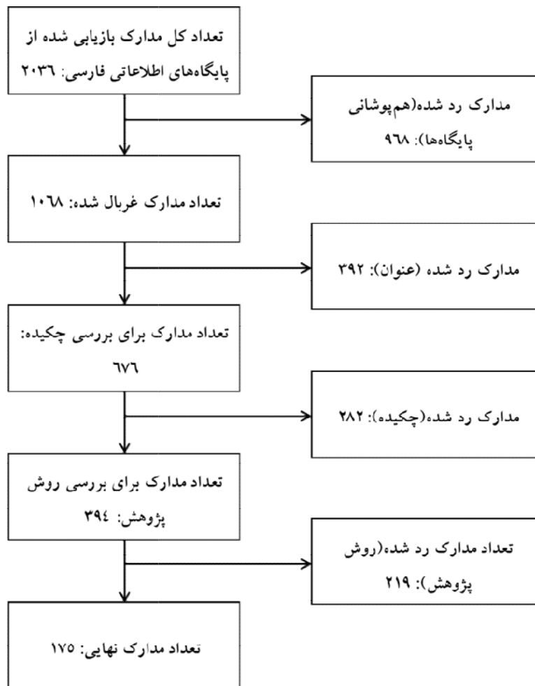
شکل ۲. الگوریتم انتخاب مدارک مناسب جهت تحلیل

همان‌طور که در شکل ۲ نمایان است، از مجموع ۲۰۳۶ منبع بازیابی شده تعداد ۱۰۶۸ منبع بعد از حذف مدارک هم‌پوشانی بین پایگاه‌ها به دست آمد که سپس در مراحل غربال‌گری، عنوان‌ها، منابع، چکیده منابع و در نهایت روش پژوهش منابع به ترتیب تعداد منابع از ۱۰۶۸ به