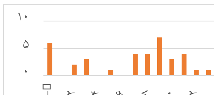
نمودار ۲. روند توجه به رابطه کارمند و سازمان در سال‌های ۱۹۷۴-۲۰۲۰

باتوجه به توزیع مطالعه‌ها در طول زمان، تعداد درخور توجهی از مطالعه‌های بین سال‌های ۲۰۱۴ تا ۲۰۲۰ منتشر شده است (بیش از ۴۴ مقاله). علاوه بر این، تنها شش مقاله تا سال ۲۰۰۰، به طور دقیق در سال‌های ۱۹۷۴، ۱۹۷۷، ۱۹۹۸، ۱۹۹۷، ۲۰۰۰ نوشته شده است. بنابراین در دهه اخیر روند مشارکت در این حوزه روند افزایشی داشته است. نمودار ۲ تعداد و سال انتشار مقاله‌های انتخاب شده را نشان می‌دهد.