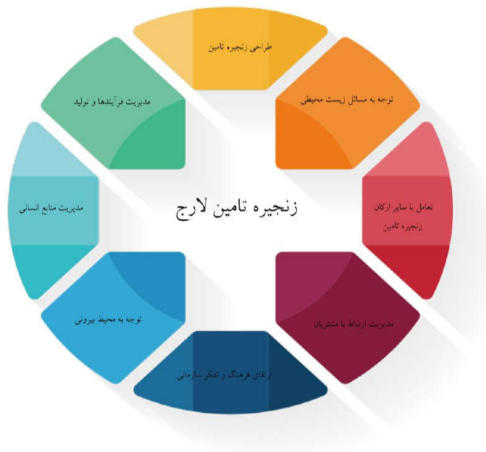
شکل ۲. الگو جامع عوامل کلیدی زنجیره تأمین لارج

فرا ترکیب روشی است که با استفاده از واژه‌های کلیدی، متغیرهای بیشتری مورد مطالعه قرار می‌گیرند و با ترکیب پژوهش‌های کیفی پیشین چارچوب گسترده‌تری نسبت به پژوهش‌های پیشین ارائه می‌دهند. براساس این روش، چارچوب نهایی زنجیره تأمین لارج در قالب یک الگو مفهومی جامع براساس شکل ۲ ارائه شد که هر بعد نیز شامل مؤلفه‌هایی است که در مراحل روش فرا ترکیب به آنها اشاره شده است. بنابراین باتوجه به اینکه چارچوب پیشنهادی و ابعاد و عوامل شناسایی شده مورد تأیید خبرگان و کارشناسان متخصص حوزه زنجیره تأمین قرار گرفته است، چارچوب حاضر می‌تواند کمک شایانی به پژوهشگران و مدیران سازمان‌ها برای پیاده‌سازی زنجیره تأمین لارج کند.