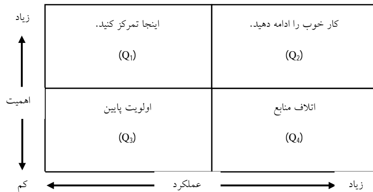
شکل 1. ماتریس عملکرد-اهمیت [31]

ماتریس تجزیه و تحلیل عملکرد-اهمیت، برای اولین بار به وسیله مارتیلا و جیمز 1 (1977) ارائه شد [31]. فرض اساسی در روش تحلیل عملکرد - اهمیت این است که سطوح رضایت مشتری از مؤلفه‌ها یا معیارهای 2 مورد نظر سازمان، تحت تأثیر انتظارات و قضاوت‌های مشتریان در خصوص عملکرد سازمان است. برای انجام تجزیه و تحلیل لازم است سطوح عملکرد و درجه رضایت از هر مؤلفه (معیار) براساس داده‌های گردآوری شده مشخص شود. این روش به سازمان‌ها کمک می‌کند تا با بررسی عدم برابری بین عملکرد-اهمیت، شکاف‌ها را شناسایی کنند. عمده‌ترین ابزار در این مدل، ماتریس IPA است. در واقع نقش اساسی این ماتریس، کمک به فرایند تصمیم‌گیری با در نظر گرفتن چهار ناحیه تصمیم برای تعیین اولویت مؤلفه‌ها با هدف بهبود یا ارتقا است [32]. براساس ابعاد «اهمیت» و «عملکرد» چهار ناحیه در ماتریس مشخص می‌شود که در شکل 1 نشان داده شده است: