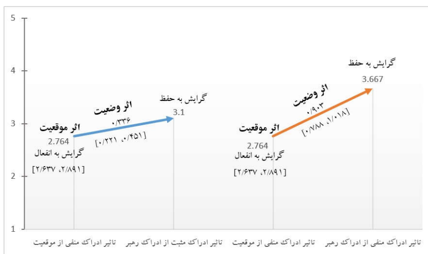
نمودار ۲. نمودار مدل پیش‌بینی‌کننده رفتار کارکنان در موقعیت تهدید

باتوجه به آنچه تشریح شد، نمودار پیش‌بینی‌کننده رفتار، مبتنی بر نتایج حاصل از مدل کیفی مبنا و مدل آمیخته در بانک‌های دولتی و شبه‌دولتی ایران به صورت زیر قابل ترسیم است: