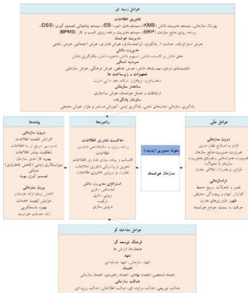
شکل 1. الگوی کدگذاری (مدل داده‌بنیاد سازمان هوشمند براساس یافته‌های پژوهش)

هوشمند» به‌عنوان مقوله محوری در نظر گرفته شد، زیرا رد پای این مقوله در اغلب داده‌ها وجود داشت و مفهومی انتزاعی بود که در تمام مصاحبه‌ها به‌وضوح به آن اشاره می‌شد. الگوی کدگذاری حاصل از یافته‌های پژوهش در شکل 1 ارائه شده است.