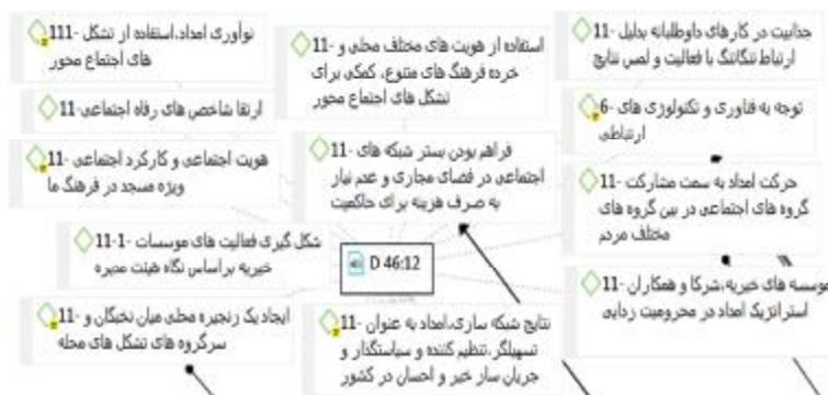
شکل 1. برشی از کدگذاری یکی از مصاحبه‌ها در نرم‌افزار اطلس‌تی 8

کدگذاری باز، مفهوم‌سازی در اولین سطح انتزاع است و بهتر است توجه پژوهشگر معطوف به درک مفهوم مورد بحث باشد و نه به واژه‌هایی که برای تشریح رویدادها به کار می‌رود [35]، ص 110]. از این رو در این پژوهش به کدگذاری نکات و مفاهیم کلیدی به جای تحلیل جزء به جزء و بسیار خرد پرداخته شد تا تمرکز بیشتری روی مفهوم اصلی انجام شود. همچنین مقایسه مستمر به شکل مداوم در طول فرایند پژوهش انجام شد و رفت و برگشتی بودن فرایند به شکل مطلوب رعایت گردید. علاوه بر این، به دلیل اهمیت یادداشت‌های نظری در رویکرد کلاسیک، طی فرایند کدگذاری باز، نکات مهم و کلیدی در بخش یادداشت‌های نرم‌افزار اطلس‌تی ثبت می‌شد تا پرورش مفاهیم و شکل‌گیری روابط آنها به خوبی انجام شده و در نهایت، نظریه اصلی از غنای نظری مطلوبی برخوردار باشد. شکل 1 بخشی از کدگذاری یکی از مصاحبه‌ها را در نرم‌افزار اطلس‌تی نشان می‌دهد.