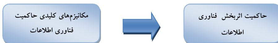
شکل 3 چارچوب نظری پژوهش

چارچوب نظری این پژوهش درصدد شناسایی مکانیزم‌های کلیدی، بررسی وضعیت مکانیزم‌ها و همچنین بررسی ارتباط بین مکانیزم‌های شناسایی شده و اثربخشی حاکمیت فناوری اطلاعات در صنعت بانکداری ایران می‌باشد. در فاز شناسایی، متغیرهای عملیاتی - که مکانیزم‌های کلیدی و مؤثر بر حاکمیت فناوری اطلاعات می‌باشند - مطرح است و در فاز بررسی، متغیرهای مستقل، «مکانیزم‌های شناسایی شده» و متغیر وابسته «حاکمیت اثربخش فناوری اطلاعات» می‌باشند. در این راستا چارچوب نظری پژوهش در شکل 3 ارائه شده است.