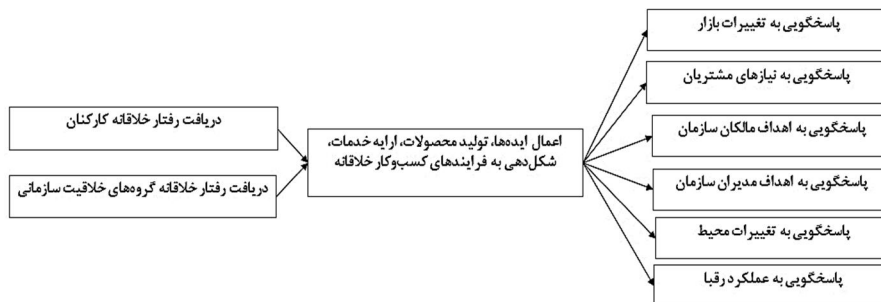
شکل ۷ مدل مفهومی مربوط به سازمان