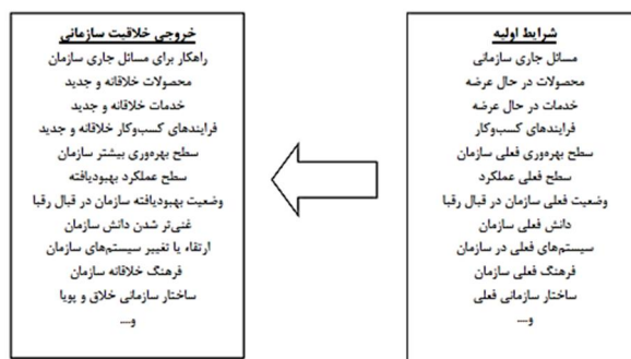
شکل ۲ فرایند تبدیل شرایط اولیه به خروجی خلاقیت سازمانی