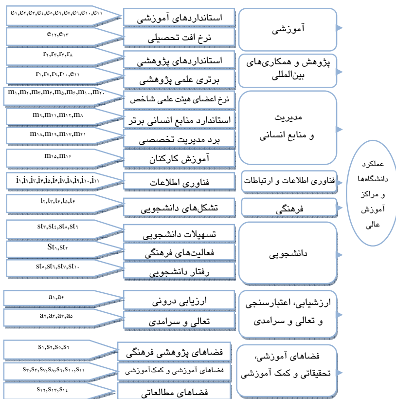
نمودار ۳ مدل مفهومی نهایی

می‌گیرد. در جدول اشتراکات اگر شاخصی کمتر از ۰/۵ باشد، باید آن را حذف کرد. در این پژوهش تنها عامل m_1 ، از این مقدار کمتر بوده است که حذف شده است. جدول کل واریانس تبیین‌شده نشان می‌دهد که شاخص‌ها جمعاً ۱۸ گروه را تشکیل می‌دهند. این گروه‌ها ۸۰/۶ درصد واریانس را پوشش می‌دهند که در واقع نشان‌دهنده روایی مناسب سؤالات (شاخص‌ها) می‌باشد. با نهایی‌شدن روش‌های برآورد و روش‌های چرخش عاملی، ماتریس نهایی فاکتور عاملی شاخص‌های ارزیابی و رتبه‌بندی عملکرد شکل می‌گیرد. بر اساس نتایج حاصل از این ماتریس مدل مفهومی نهایی پژوهش به صورت زیر حاصل می‌شود. لازم به ذکر است که نامگذاری گروه‌های حاصل‌شده در این بخش توسط محقق صورت پذیرفته است.