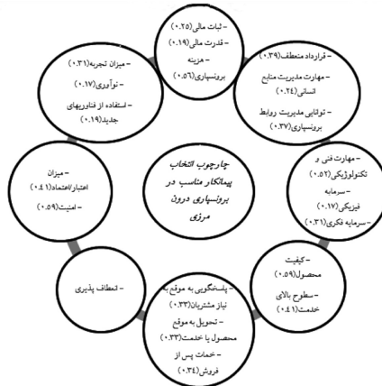
شکل ۲ چارچوب انتخاب پیمانکار مناسب در برون‌سپاری درون‌مرزی - برون‌شرکتی

در نهایت با استفاده از معیارهای تأیید شده و محاسبه وزن آن‌ها چارچوب انتخاب پیمانکار در برون‌سپاری درون‌مرزی به دست آمد که در شکل ۲ قابل مشاهده است. برای برون‌سپاری برون‌مرزی نیز با استفاده از معیارها و مؤلفه‌های تأیید شده و محاسبه وزن آن‌ها چارچوبی برای انتخاب پیمانکار ایجاد شد که در شکل ۳ قابل مشاهده است.