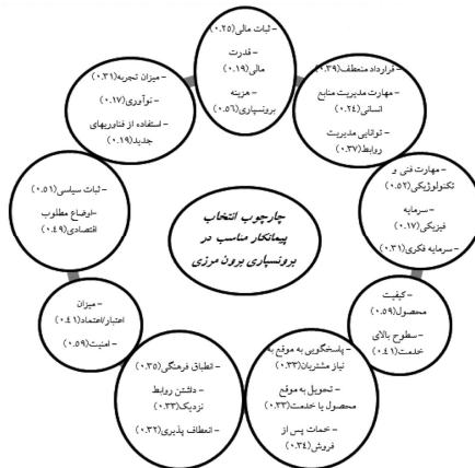
شکل ۳ چارچوب انتخاب پیمانکار مناسب در برون‌سپاری برون‌مرزی - برون‌شرکتی

در نهایت با استفاده از معیارهای تأیید شده و محاسبه وزن آن‌ها چارچوب انتخاب پیمانکار در برون‌سپاری درون‌مرزی به دست آمد که در شکل ۲ قابل مشاهده است. برای برون‌سپاری برون‌مرزی نیز با استفاده از معیارها و مؤلفه‌های تأیید شده و محاسبه وزن آن‌ها چارچوبی برای انتخاب پیمانکار ایجاد شد که در شکل ۳ قابل مشاهده است.