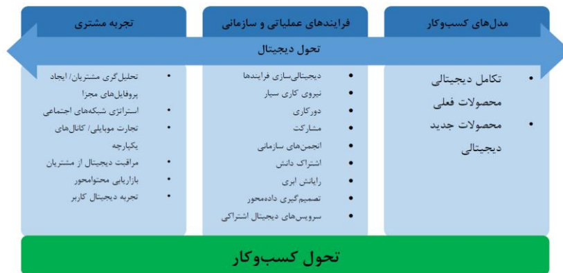
شکل ۱. ابعاد تحول دیجیتال [۱۰]

مطالعات متعدد به وسیله شرکت‌های مشاوره مدیریت مطرح نشان می‌دهد که اصلی‌ترین محدودیت توفیق تحول دیجیتال، فرهنگ و مهارت‌های دیجیتال است. نکته دیگر آن است که دیجیتالی‌سازی با الکترونیکی کردن متفاوت است. محیط دیجیتال، همان محیط آنلاین و الکترونیکی نیست. محیط دیجیتال، تلفیقی از محیط آنلاین (IT) و آفلاین (فیزیکی) به منظور ایجاد تجربه‌ای نوین برای نیروهای درون و برون سازمان است [۸]. از جنبه مدیریتی و ساختاری می‌توان تحول دیجیتال را شامل پاسخ به روندهای دیجیتال خارج از کنترل سازمان دانست؛ بدین شکل تحول یک واژه جامع شامل جنبه مدیریتی راهبردی، رهبری و ساختار برای اجرای آن است [۹]. کاپیتانی ۱ [۱۰] ابعاد تحول دیجیتال را شامل موارد ذیل می‌داند: همان‌طور که در شکل ۱ نشان می‌دهد، تحول دیجیتال تمامی ابعاد سازمانی، از فرایندها تا کارکنان و محصولات را در بر می‌گیرد و به دنبال ایجاد تغییرات اساسی با رویکردها نوین در این ابعاد است. با وجود گذشت چندین سال از مطرح شدن تحول دیجیتال هنوز درک یکسانی از این مفهوم در میان مدیران وجود ندارد [۱۱]. اما تعریفی که بیشترین اشتراک را در بین پژوهشگران مختلف دارد، بیان می‌کند که تحول دیجیتال به معنای مدل‌های کسب‌وکار، تجربه سود برندگان و فرایندهای سازمانی با کمک فناوری‌های نوظهور در راستای ارزش‌آفرینی و بهره‌وری تمامی ابعاد سازمان و بقا در عصر دیجیتال می‌باشد.