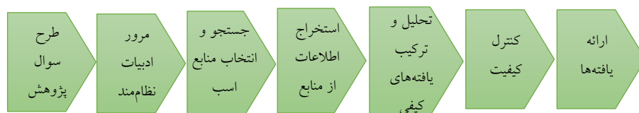
شکل ۲. گام‌های فراترکیب براساس روش هفت مرحله‌ای [۱۴]

فراترکیب با فراهم کردن یک نگرش نظام‌مند برای پژوهشگران از راه ترکیب پژوهش‌های کیفی مختلف به کشف موضوعات و استعاره‌های جدید و اساسی می‌پردازد. پژوهشگران از راه بررسی یافته‌های منابع اصلی پژوهش، واژه‌هایی را آشکار و ایجاد می‌کنند که نمایش جامع‌تری از پدیده تحت بررسی را نشان می‌دهد. مشابه نگرش نظام‌مند، استفاده از فراتلفیق نتیجه‌ای را حاصل می‌کند که بزرگ‌تر از مجموع بخش‌های آن است [۱۳]. گام‌های این پژوهش براساس روش هفت مرحله‌ای سندلوسکی و باروسو (۲۰۰۷) در فراترکیب است که این مراحل در شکل ۲ نشان داده شده است [۱۴].