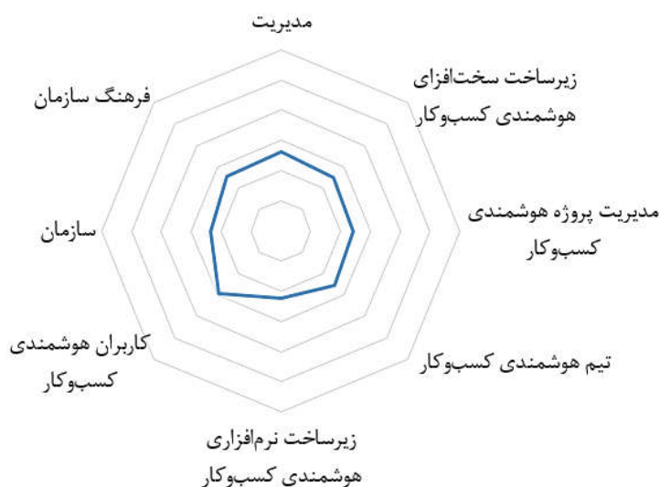
شکل ۲. آمادگی دانشگاه شیراز برای پیاده‌سازی سیستم هوشمندی کسب‌وکار

برای پاسخ به پرسش سوم پژوهش، پس از جمع‌آوری داده‌های لازم جهت سنجش میزان آمادگی دانشگاه شیراز و پیاده‌سازی سیستم هوشمندی کسب‌وکار به‌وسیله ۶۰ نفر از استادان، کارکنان و مدیران دانشگاه شیراز که به‌صورت قضاوتی هدفمند انتخاب شدند، آنگاه به‌وسیله پرسش‌نامه‌های مجزا، داده‌ها به اعداد مثلی تبدیل و سپس با استفاده از میانگین قطعی اعداد مثلی حاصل شده، شکاف موجود میان داده‌های نهایی با سقف امتیازها، یعنی ۹ محاسبه شد و با ضریب نمود، نتایج حاصل شده در این مرحله و مرحله وزن‌دهی به روش بهترین-بدترین فازی، اولویت‌های دانشگاه شیراز برای تمرکز بیشتر به‌منظور افزایش آمادگی پیاده‌سازی سیستم هوشمندی کسب‌وکار از اولویت بیشتر به کمتر در جدول ۵ ارائه شد. سپس آمادگی کلی دانشگاه شیراز در نمودار شکل ۲ نشان داده شد.