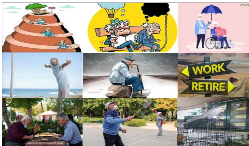
شکل ۱. تصاویر ارائه شده به وسیله برخی از مشارکت‌کنندگان

در طول اجرای مراحل بالا، از مشارکت‌کننده درخواست می‌شود به تناسب هر سلول ماتریس، اگر براساس با نظر وی ساختار سطر در ساختار ستون متناظر با آن سلول اثر می‌گذارد، در آن ستون عدد ۱ و در غیر این صورت عدد صفر را بنویسد. در ادامه، از هریک از مشارکت‌کنندگان خواسته می‌شد تا با استفاده از تصاویر منتخب خود، یک تصویر خلاصه ایجاد کنند و توضیحاتی درباره آن ارائه کنند. در نهایت، نقشه اجماعی استخراج و ترسیم شد. از آنجاکه نقشه اجماعی، یک مدل ذهنی مشترک یا تصویری از نحوه ارتباطات و افکار و احساسات مشترک میان بعضی افراد است، ساختارهایی را انتخاب کردیم که یک‌سوم مشارکت‌کنندگان آنها را متذکر شده بودند. همچنین روابطی میان این ساختارها در نقشه اجماعی باقی ماندند که دست‌کم یک‌چهارم مشارکت‌کنندگان آنها را برقرار می‌دانستند [۴۰]. در ادامه تصاویر ارائه شده به وسیله برخی از مشارکت‌کنندگان (شکل ۱)، جدول مفاهیم و ساختارهای برگرفته از مصاحبه با یکی از مشارکت‌کنندگان (جدول ۳) و همچنین نقشه ذهنی احدی از مشارکت‌کنندگان (شکل ۲) آورده شده است.