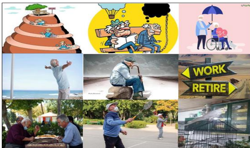
شکل ۱. تصاویر ارائه‌شده به‌وسیله برخی از مشارکت‌کنندگان

در طول اجرای مراحل بالا، از مشارکت‌کننده درخواست می‌شود به تناسب هر سلول ماتریس، اگر براساس با نظر وی ساختار سطر در ساختار ستون متناظر با آن سلول اثر می‌گذارد، در آن ستون عدد ۱ و در غیر این صورت عدد صفر را بنویسد. در ادامه، از هریک از مشارکت‌کنندگان خواسته می‌شد تا با استفاده از تصاویر منتخب خود، یک تصویر خلاصه ایجاد کنند و توضیحاتی درباره آن ارائه کنند. در نهایت، نقشه اجماعی استخراج و ترسیم شد. از آنجاکه نقشه اجماعی، یک مدل ذهنی مشترک یا تصویری از نحوه ارتباطات و افکار و احساسات مشترک میان بعضی افراد است، ساختارهایی را انتخاب کردیم که یک‌سوم مشارکت‌کنندگان آنها را متذکر شده بودند. همچنین روابطی میان این ساختارها در نقشه اجماعی باقی ماندند که دست‌کم یک‌چهارم مشارکت‌کنندگان آنها را برقرار می‌دانستند [۴۰]. در ادامه تصاویر ارائه‌شده به‌وسیله برخی از مشارکت‌کنندگان (شکل ۱)، جدول مفاهیم و ساختارهای برگرفته از مصاحبه با یکی از مشارکت‌کنندگان (جدول ۳) و همچنین نقشه ذهنی احدی از مشارکت‌کنندگان (شکل ۲) آورده شده است.