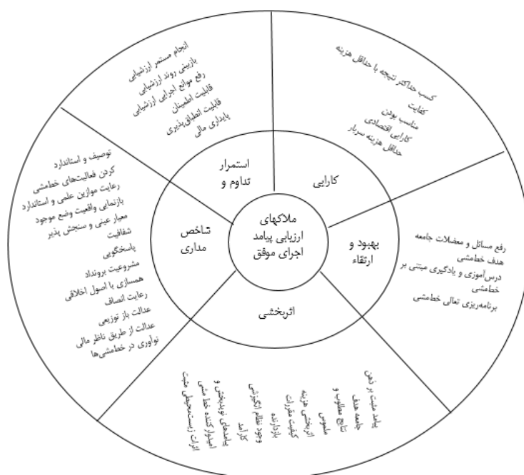
شکل ۱. مدل مفهومی پژوهش

مدل مفهومی پژوهش، یک الگوی نظری مبنی بر روابط میان شماری از عواملی که در پژوهش از اهمیت بیشتری برخوردارند. این چارچوب با بررسی سوابق پژوهش در قلمرو مسئله جریان پیدا می‌کند. در آمیختن باورهای منطقی پژوهشگر با پژوهش‌های انتشار یافته به منظور ایجاد مبانی علمی برای بررسی مسئله مورد تحقیق جایگاه ویژه‌ای دارد [۳۴، ص ۹۴]. با توجه به پیشینه پژوهش و پیشینه تجربی آن، مدل مفهومی پژوهش احصاء شد. در زیر شکل مدل مفهومی پژوهش با ۳۵ نشانگر در ۵ بُعد ارائه شده است.