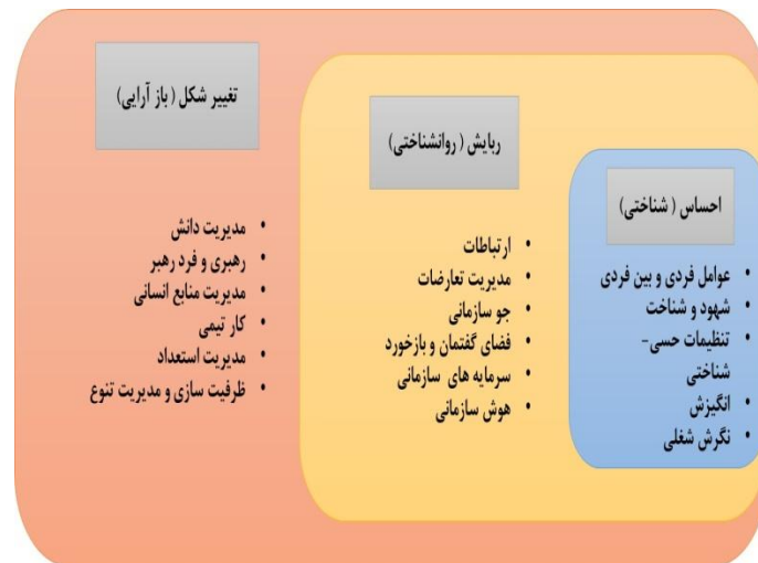
نمودار ۳. بنیان‌های رفتاری قابلیت‌های پویا در سه بعد ادراک،

براساس کدهای نهایی استخراج‌شده از پیشینه مطالعاتی مرور شده در جدول ۱ می‌توان ۱۵ شاخص استخراجی را در سه بعد «احساس»، «ربایش» و «تغییر شکل» سازمان‌دهی کرد. در زمینه جای دادن شاخص‌ها در سه بعد مذکور، باز هم پژوهشگر از ادبیات و مطالعه‌های پیشین کمک گرفته است، به طوری که با مرور چندین باره مطالعه‌های بررسی‌شده، سعی در جایگزاری و جانمایی بهینه شاخص‌ها در ابعاد سه‌گانه «احساس»، «ربایش» و «تغییر شکل» شده است. در برخی موارد، برخی شاخص‌ها قابلیت جانمایی در دو بعد را داشته‌اند، برای مثال شاخص «ارتباطات» قابلیت جایگزاری در دو بعد «ربایش» و «تغییر شکل» را به گواه مطالعات پیشین داشته است، اما از آنجایی که بیشترین تأکید بر نقش این شاخص در بعد «ربایش» بوده است و اهمیت ارتباطات در روابط بین فردی و گروهی در مرحله «ربایش»، زمینه‌ساز توسعه بیشتر فرصت‌ها است، بنابراین این شاخص در بعد «ربایش» جایگزاری شده است [۲۰؛ ۲۳] (نمودار ۳).