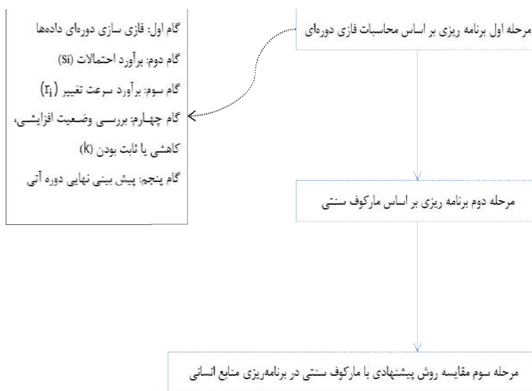
شکل ۱. فرایند ارائه روش پیشنهادی و کاربرد آن در مقایسه با مدل سنتی

این پژوهش از نظر گردآوری داده به صورت کتابخانه‌ای است داده‌های پژوهش از طریق مطالعه و بررسی اسناد و مدارک شرکت نادکو به دست آمده‌اند، و پس از ارائه الگو به کاربرد تکنیک در مورد مطالعه اقدام می‌شود و مدل از نوع تحقیقات کمی محسوب می‌شود و از نظر هدف توصیفی است و چون در مقطعی از زمان انجام می‌گیرد از نظر زمانی نیز مقطعی است. در این پژوهش اطلاعات شرکت نادکو مورد بررسی قرار می‌گیرد. فرایند کلی پژوهش در شکل ۱ نشان داده شده است.