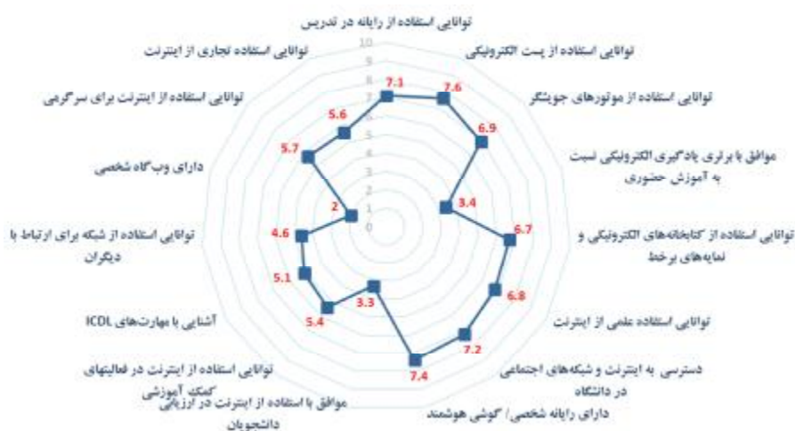
شکل 4. نمودار راداری آمادگی استادان برای یادگیری الکترونیکی در دانشگاه‌های منتخب

همان‌طور که در شکل 4 مشاهده می‌شود، توزیع امتیاز معیارهای ارزیابی آمادگی الکترونیکی استادان به‌گونه‌ای متفاوت از دانشجویان رقم خورده است. البته در این بخش نیز اغلب معیارها دارای امتیاز بیش از «متوسط» هستند (11 معیار از 15 معیار بررسی شده)، اما تعداد معیارهایی که در سطح «متوسط» و «ضعیف» هستند، نسبت به بخش دانشجویی بیشتر است (4 معیار نسبت به سه معیار در بخش ارزیابی آمادگی دانشجویان). نتایج ارزیابی آمادگی استادان نشان می‌دهد که تنها معیار «توانایی استفاده از پست الکترونیکی» (با امتیاز 7/6) در وضعیت «عالی» قرار دارد. در اینجا نیز همچون بخش دانشجویی، کمترین امتیاز مربوط به «دارا بودن وبگاه شخصی» است، هرچند امتیاز آن برای استادان بالاتر است.