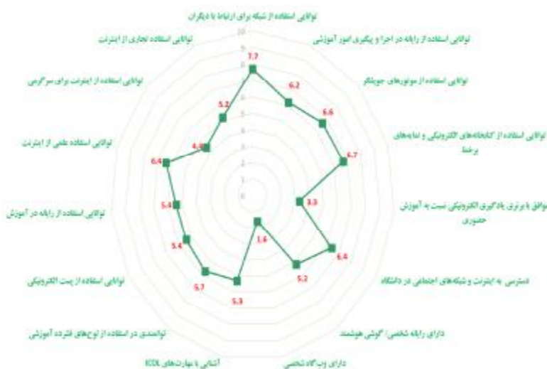
شکل 3. نمودار راداری آمادگی دانشجویان برای یادگیری الکترونیکی در دانشگاه‌های منتخب

همان‌طور که پیش از این اشاره شد، در ارزیابی سطح آمادگی یادگیری الکترونیکی دانشجویان مورد مطالعه در دانشگاه‌های منتخب از 15 سنجه استفاده شده است (جدول 5) که از جنبه‌های مختلف مهارتی، فرهنگی، افزاری و شبکه‌ای آمادگی دانشجویان را مورد سنجش قرار می‌دهد. جمع‌بندی نتایج پاسخ دانشجویان مورد مطالعه به پرسش‌نامه در پیوست 4 ارائه شده و براساس آن، آمادگی دانشجویان دانشگاه‌های منتخب در نمودار راداری شکل 3 قابل مشاهده است.