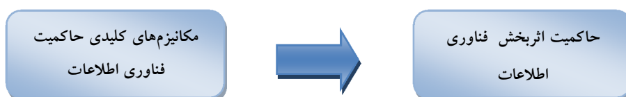
شکل 3 چارچوب نظری پژوهش

چارچوب نظری این پژوهش درصدد شناسایی مکانیزم‌های کلیدی، بررسی وضعیت مکانیزم‌ها و همچنین بررسی ارتباط بین مکانیزم‌های شناسایی شده و اثربخشی حاکمیت فناوری اطلاعات در صنعت بانکداری ایران می‌باشد. در فاز شناسایی، متغیرهای عملیاتی - که مکانیزم‌های کلیدی و مؤثر بر حاکمیت فناوری اطلاعات می‌باشند - مطرح است و در فاز بررسی، متغیرهای مستقل، «مکانیزم‌های شناسایی شده» و متغیر وابسته «حاکمیت اثربخش فناوری اطلاعات» می‌باشند. در این راستا چارچوب نظری پژوهش در شکل 3 ارائه شده است.