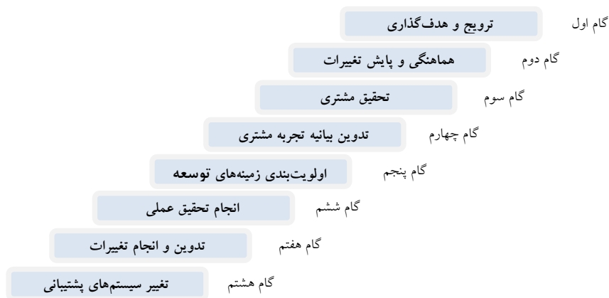
شکل 1. مراحل 8 گانه بهبود تجربه مشتری