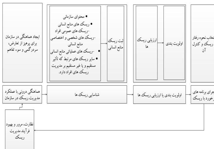
شکل ۱. مدل مدیریت ریسک منابع انسانی [۲۴]

در شکل ۱ مدلی برای مدیریت ریسک منابع انسانی نشان داده شده است: