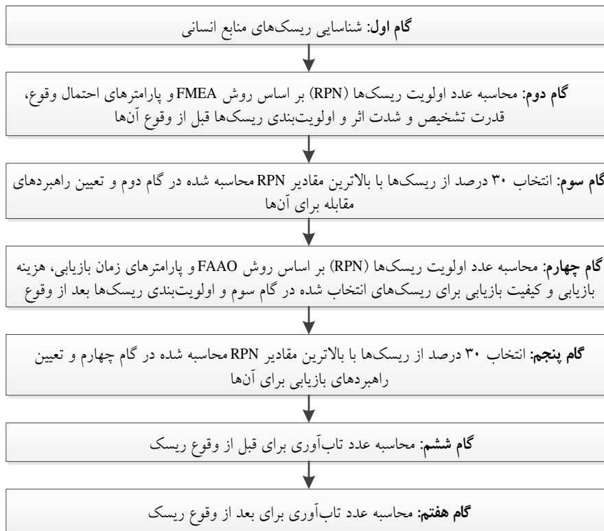
شکل ۲. گام‌های فرایند پژوهش