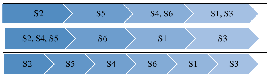
شکل 3 رتبه‌بندی نهایی تأمین‌کنندگان

در آخرین گام به منظور رتبه‌بندی گزینه‌ها (تأمین‌کنندگان) یک بار به صورت نزولی و یک بار به صورت صعودی رتبه‌بندی انجام گرفت و در نهایت با استفاده از اشتراک ارزش رتبه‌بندی صعودی و نزولی، رتبه‌بندی نهایی حاصل شد. در شکل 3 به ترتیب از بالا به پایین رتبه‌بندی نزولی، صعودی و نهایی انجام شده است.