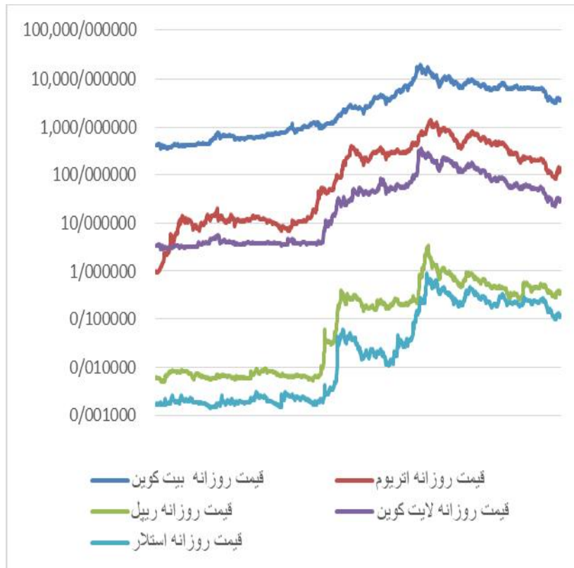
شکل ۲. تغییرات قیمت ارزهای دیجیتال از ۲۰۱۶ تا ۲۰۱۸ به دلار (خروجی نرم‌افزار)