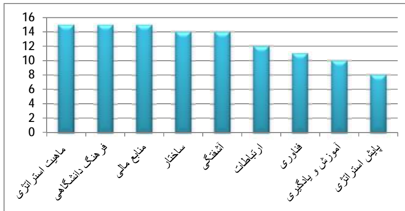
شکل 2. رتبه بندی موانع اجرای کارآمد استراتژی در دانشگاه‌ها و مراکز آموزش عالی