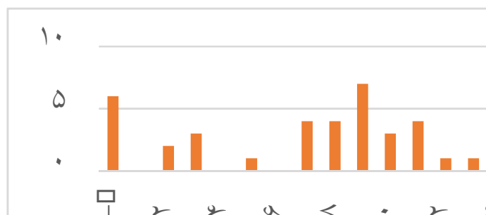
نمودار ۲. روند توجه به رابطه کارمند و سازمان در سال‌های ۱۹۷۴-۲۰۲۰

باتوجه به توزیع مطالعه‌ها در طول زمان، تعداد درخور توجهی از مطالعه‌های بین سال‌های ۲۰۱۴ تا ۲۰۲۰ منتشر شده است (بیش از ۴۴ مقاله). علاوه بر این، تنها شش مقاله تا سال ۲۰۰۰، به‌طور دقیق در سال‌های ۱۹۷۴، ۱۹۷۷، ۱۹۹۸، ۱۹۹۷، ۲۰۰۰ نوشته شده است. بنابراین در دهه اخیر روند مشارکت در این حوزه روند افزایشی داشته است. نمودار ۲ تعداد و سال انتشار مقاله‌های انتخاب شده را نشان می‌دهد.