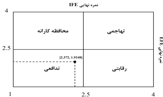
شکل ۳. مختصات ماتریس داخلی و خارجی (IE)