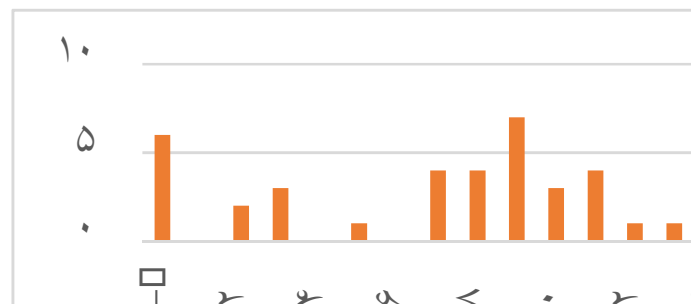
نمودار ۲. روند توجه به رابطه کارمند و سازمان در سال‌های ۱۹۷۴-۲۰۲۰

باتوجه به توزیع مطالعه‌ها در طول زمان، تعداد درخور توجهی از مطالعه‌های بین سال‌های ۲۰۱۴ تا ۲۰۲۰ منتشر شده است (بیش از ۴۴ مقاله). علاوه بر این، تنها شش مقاله تا سال ۲۰۰۰، به طور دقیق در سال‌های ۱۹۷۴، ۱۹۷۷، ۱۹۹۸، ۱۹۹۷، ۲۰۰۰ نوشته شده است. بنابراین در دهه اخیر روند مشارکت در این حوزه روند افزایشی داشته است. نمودار ۲ تعداد و سال انتشار مقاله‌های انتخاب شده را نشان می‌دهد.