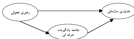
شکل 1 الگوی مفروض پژوهش

دانشگاه‌های موفق در ویژگی‌هایی مانند رهبری تحولی 1 قوی، انتظارات بالا از دانشجویان، جو هدایت‌شده یادگیری سهیم می‌باشند. انتظار می‌رود که اقدام‌های رهبری تحولی بتواند درگیری استادان را در فعالیتهای یادگیری حرفه‌ای افزایش دهد که به دنبال آن دانشگاه بتواند اساتید را برای دغدغه ذهنی داشتن با آگاهی و هشیاری تحریک نماید [7]. بررسی تجربی نقش همزمان رهبری تحولی و جامعه یادگیرنده حرفه‌ای 2 به‌عنوان عوامل اثرگذار بر ایجاد هشیاری سازمانی 3 موضوعی است که کمتر به آن پرداخته شده است. پژوهشگران مقاله حاضر تلاش کرده‌اند تا میزان ارتباط رهبری تحولی با هشیاری سازمانی را در کنار نقش واسطه‌گری جامعه یادگیرنده حرفه‌ای در نظام آموزش عالی با رویکرد نظریه داده بنیاد در قالب الگوی نظری ذیل مطالعه نمایند.