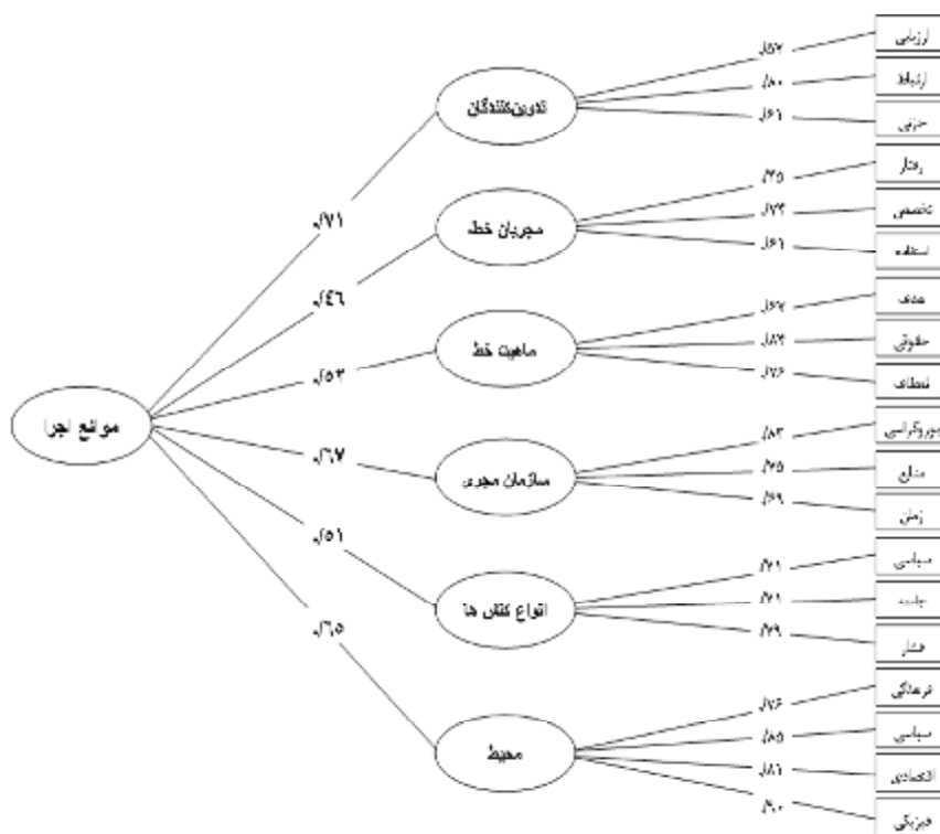
شکل 2 آزمون مدل مفهومی پژوهش در حالت ضرایب استاندارد شده

شکل 3 مدل پژوهش را در حالت ضرایب استاندارد شده نشان می دهد. همان طور که مشاهده می شود بررسی روابط و مدل مفهومی پژوهش نشان می دهد تمامی روابط پژوهش در سطح اطمینان 99 درصد مورد تأیید قرار گرفته است ( P < 0/05 ).